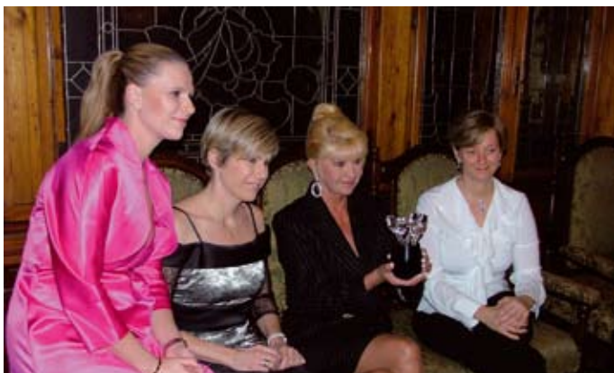
Ivana Trumpová fandila Čechům