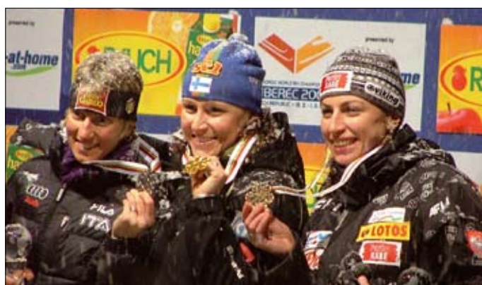
První medaile šampionátu patřily ženám