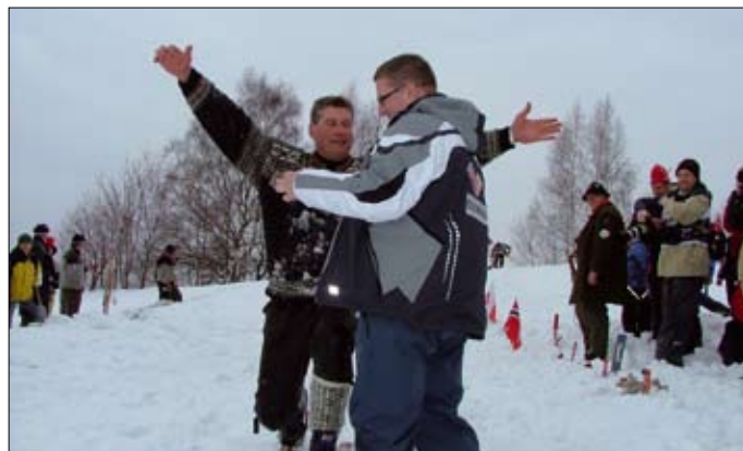
Primátor ocenil „závodníky“ na oblíbené norské K4