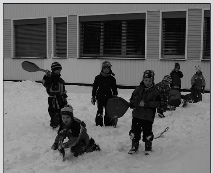
Zimní hry dětí z MŠ Motýlek před zrekonstruovaným objektem