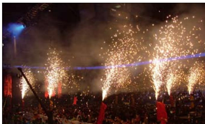
Ohnivá show zahajovacího ceremoniálu v aréně