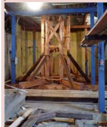
Kvůli špatnému technickému stavu musela být sejmuta celá střešní konstrukce i s věží. Ta se v současné době pod neustálým dohledem památkářů renovuje.