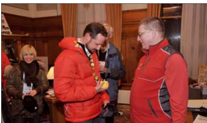
Norský princ Haakon Magnus s primátorskou insignií