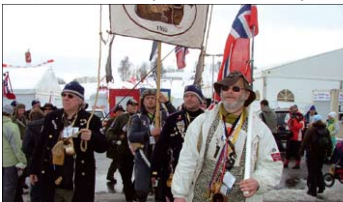
Norští fanoušci se stali „talismanem“ i libereckého MS