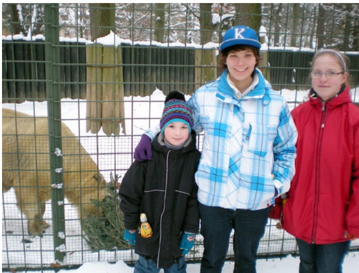
Děti si během setkání v Lidových sadech užily prohlídku liberecké zoo.

Setkání se účastnily jako hosté také pracovníce Krajského úřadu Libereckého kraje, které se zabývají sociálně-právní ochranou dětí, a pracovníce krajské pobočky Úřadu práce v Liberci, která rozhoduje o dávkách pěstounské péče a vyplácí je.