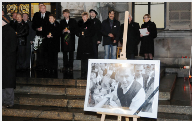
VZPOMÍNKA. Pietní shromáždění před radnicí se uskutečnilo 21. prosince.

Liberec se rozloučil s Václavem Havlem plným náměstím a zvoněním klíči.