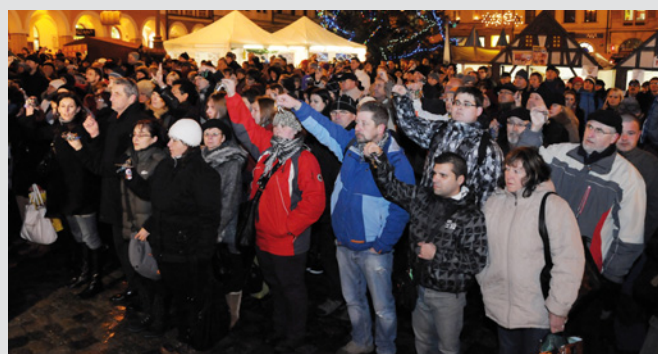
NAPOSLEDY. Stovky Liberečanů se s panem prezidentem rozloučilo zvoněním klíči.