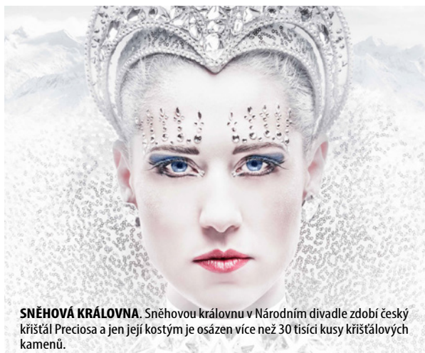
SNĚHOVÁ KRÁLOVNA. Sněhovou královnou v Národním divadle zdobí český křišťál Preciosa a jen její kostým je osázen více než 30 tisíci kusy křišťálových kamenů.

Zakrátko po nich zatoužili i na předních královských dvorech – zkrášlovaly Zrcadlovoú síň ve Versailles (1725), osvětily korunovaci Marie Terezie (1743) a obdivoval je i turecký sultán Osman II. (1754). I v dnešní době jsou hlavní doménou Preciosy Lighting speciální vybavovací akce, které realizují v luxusních hotelích, rezidencích a palácích.