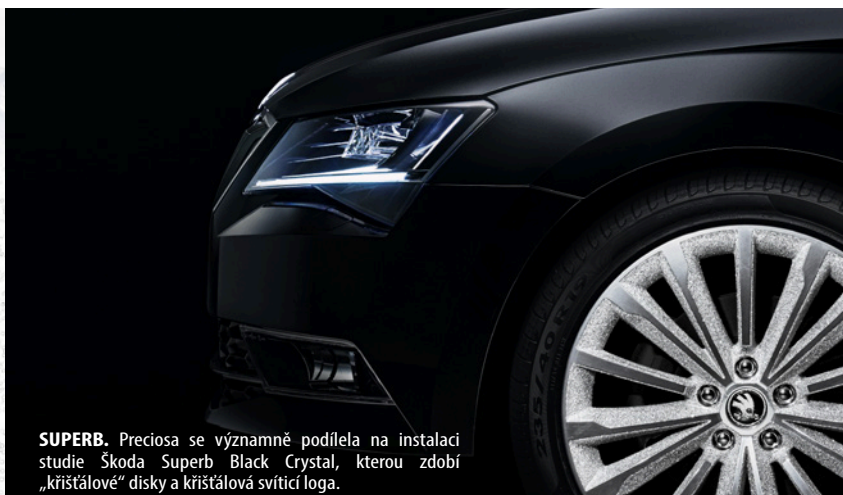
SUPERB. Preciosa se významně podílela na instalaci studie Škoda Superb Black Crystal, kterou zdobí „křišťálové“ disky a křišťálová svítící loga.