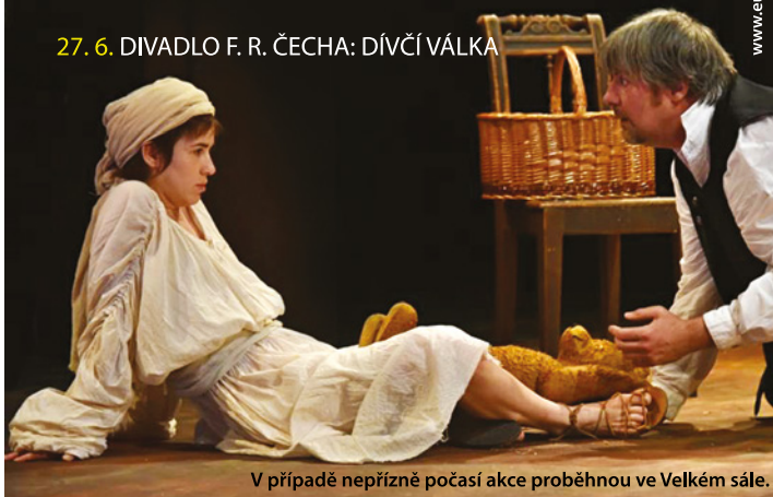
V případě nepříznivé počasí akce proběhnou ve Velkém sále.

www.eurocentrumjablonec.cz, tel.: 483 704 400