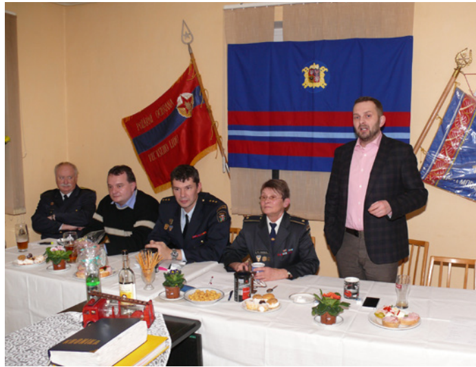
Primátor Tibor Batthyány na návštěvě u vratislavických hasičů.

Cílem bylo především zhodnocení uplynulého roku, v němž Vratislavičtí oslavili půlkulaté výročí 145 let od založení sboru (počítáno podle stále platného oficiálního roku vzniku). Členskou základnu sboru nyní tvoří 122 hasičů včetně dětí a z toho 18 dospěláků patří k výjezdové jednotce. Ta disponuje dvěma cisternovými automobilovými stříkačkami, dopravním automobilem, vysokozdviznou plošinou, požárním záchranným člunem a nafukovacím člunem. Za pomoci této výbavy loni dobrovolní hasiči z Vratislavic vyjžděli k 37 zásahům. „Většinou šlo o požáry, ale kromě nich také o tři technické zásahy, dvojí odčerpávání